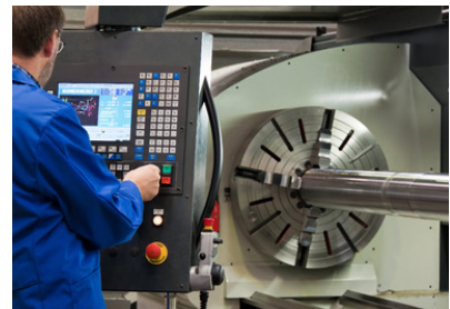
© Gina Sanders - Fotolia #18964313

Über die Maschinenversicherung können alle stationären, fahrbaren, maschinellen und elektrischen Einrichtungen und sonstige technische Anlagen versichert werden. z.B. Kessel, Motoren, Turbinen, Generatoren, Bohr-, Dreh- und Fräsmaschinen, Druck- und Falzmaschinen, Aufzüge, Hallenkräne, Förderanlagen, Sähmaschinen, Mähdrescher, Strohpressen u.v.m.